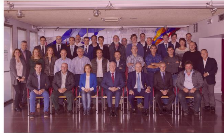
Miembros del Pleno del Consejo Regulador DOCa Rioja

Composición y funciones del Consejo Regulador