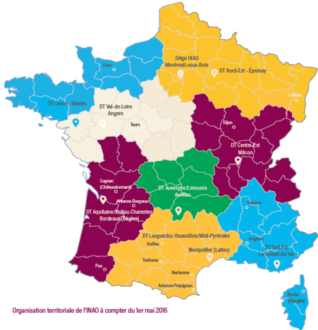
Organisation territoriale de l'INAO à compter du 1er mai 2016

INSTITUT NATIONAL DE L'ORIGINE ET DE LA QUALITÉ