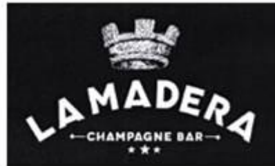
M. 1305001 LA MADERA CHAMPAGNE BAR Y DISEÑO