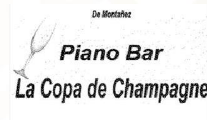
M. 1484777 DE MONTAÑEZ PIANO BAR LA COPA DE CHAMPAGNE Y DISEÑO