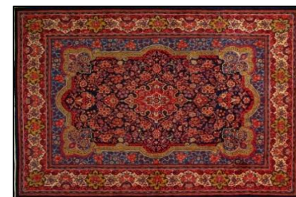
SAROUGH HANDMADE CARPET (AO956 / Irán)