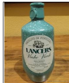
VINHO VERDE (AO564 / Portugal)