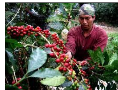
CAFE VERACRUZ (AO840 / México)