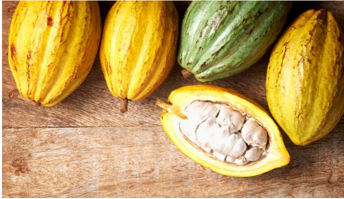
Cacao Grijalva (México)