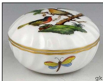
HEREND (AO737 / Hungría)