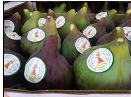
FIGUES DE DJEBBA (AO1155 / Túnez)