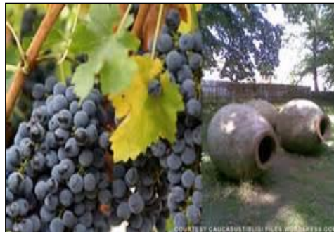
VAZISUBANI (AO871 / Georgia)