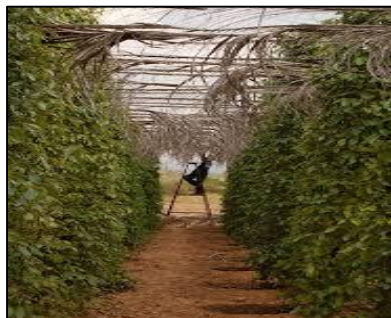
KAMPOT PEPPER (IG1152 / Camboya)