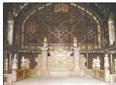
IRAN'S KORDESTAN MARBLE (AO1105 / Irán)