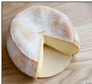
REBLOCHON (AO458 / Francia)