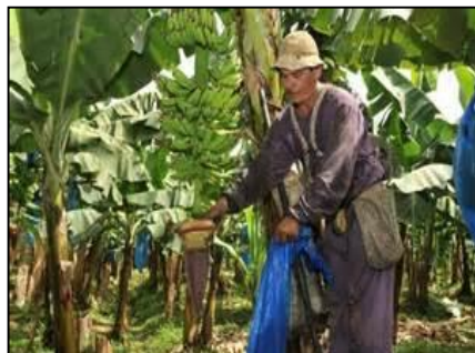
BANANO DE COSTA RICA (AO900 / Costa Rica)