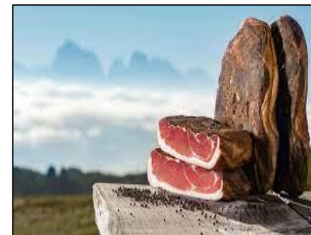
SPECK ALTO ADIGE (AO941 / Italia)