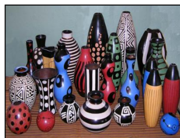
CHULUCANAS (AO869 / Perú)