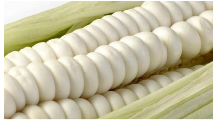
Maíz blanco gigante Cusco (Perú)