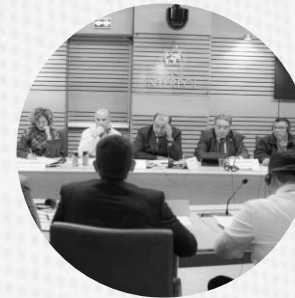
REUNIONES REGIONALES DE CASOS INVESTIGATIVOS