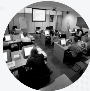
ENTRENAMIENTO Y CAPACITACIONES