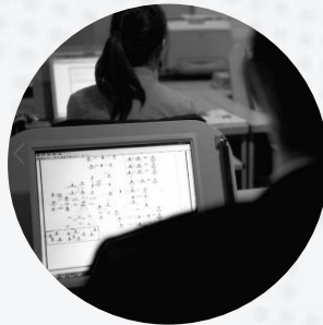
ANALISIS DE DATOS