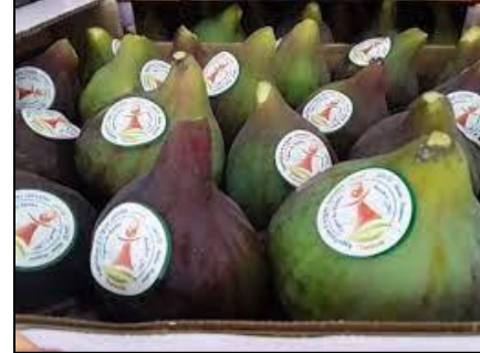
FIGUES DE DJEBBA (AO1155 / Túnez)