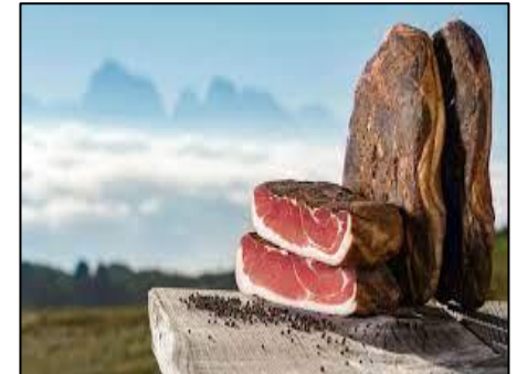
SPECK ALTO ADIGE (AO941 / Italia)