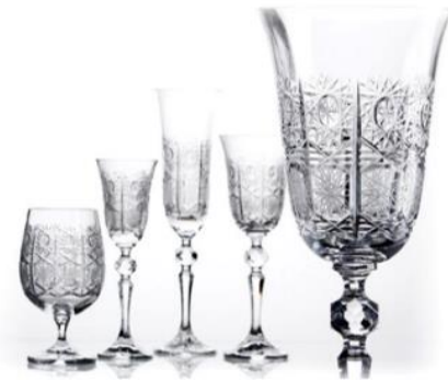
BOHEMIA GLASS (74 / Republica Checa)