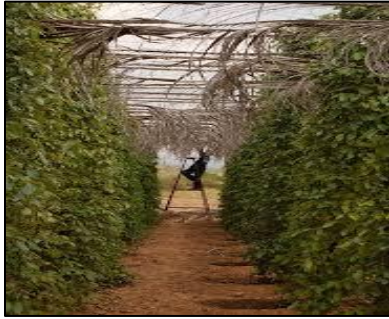
KAMPOT PEPPER (IG1152 / Camboya)