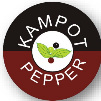
KAMPOT PEPPER (GI1 / Camboya)