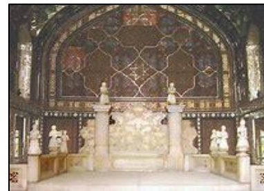
IRAN'S KORDESTAN MARBLE (AO1105 / Irán)