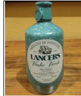
VINHO VERDE (AO564 / Portugal)