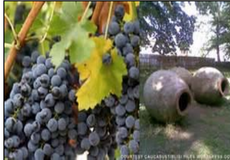
VAZISUBANI (AO871 / Georgia)