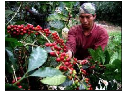
CAFE VERACRUZ (AO840 / México)