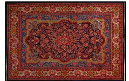
SAROUGH HANDMADE CARPET (AO956 / Irán)