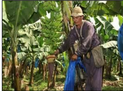
BANANO DE COSTA RICA (AO900 / Costa Rica)