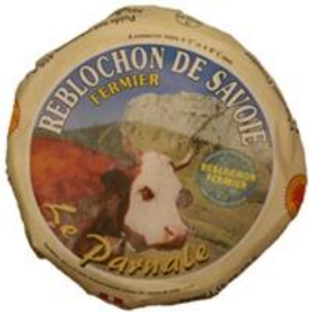
REBLOCHON (458 / Francia)