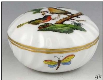
HEREND (AO737 / Hungría)