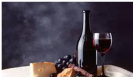
Vin de pays d'Ardèche