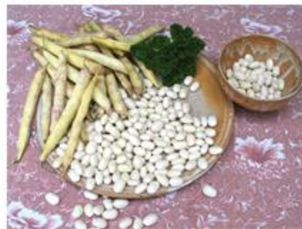
Coco de Paimpol