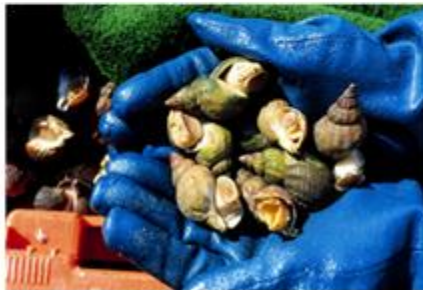
Bulot de la baie de Grandville