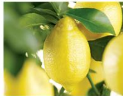
Citron de Menton