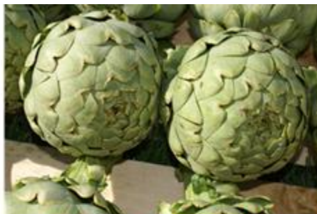
Artichaut du Roussillon