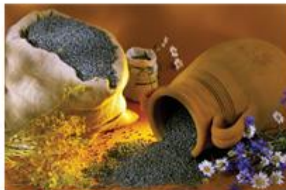
Lentilles vertes du Puy