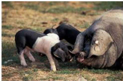
Porcs du Kintoa